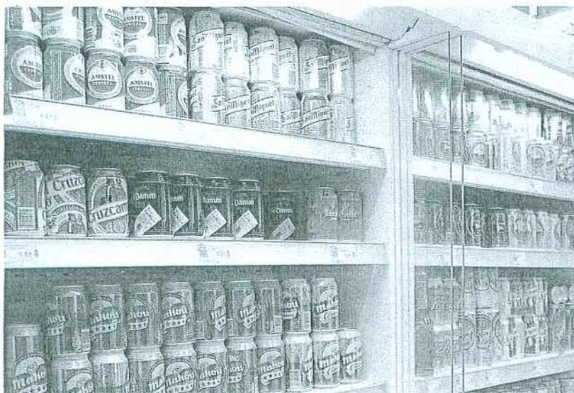
Estanterías con varias marcas de cervezas, con y sin alcohol.